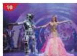
Zodiac Theatre Enjoy live production shows from the acclaimed award-winning entertainment team.

**เรือจะมีใบแจ้งสถานที่และเวลาที่ห้องพักของท่านเพื่อนให้ท่านรับหนังสือเดินทางคืน