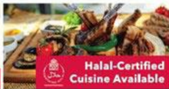
Halal-Certified Cuisine Available