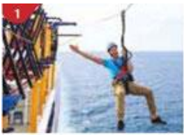
1 Ropes Course & Zipline Feel the thrill of gliding above the ocean on a 35-metre zipline.

ถ้าท่านประสงค์จะถือกระเป๋าเดินทางลงด้วยตัวเองไม่จำเป็นต้องวางไว้ที่หน้าห้องพัก