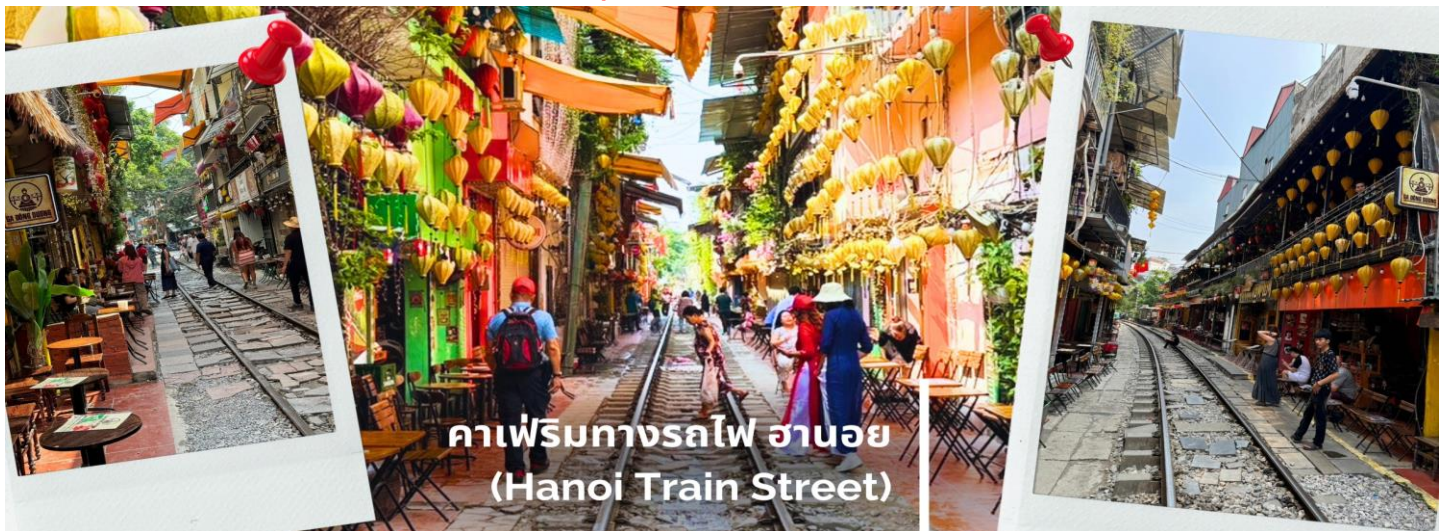
คาเฟ่ริมทางรถไฟ ฮานอย (Hanoi Train Street)