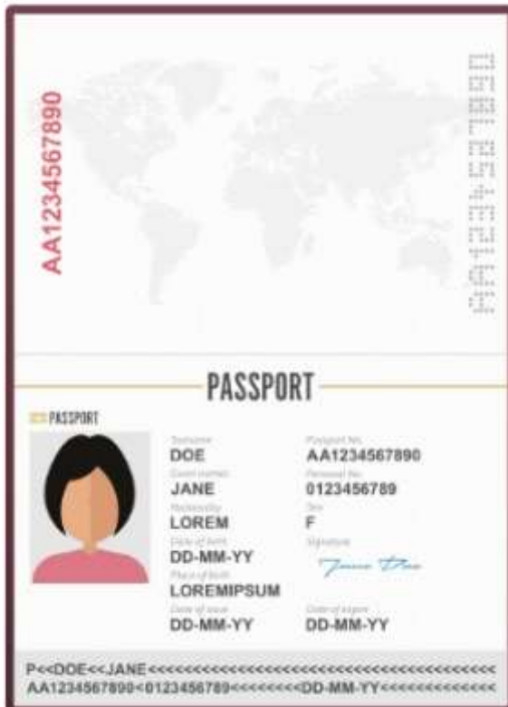
รูปถ่ายหน้าพาสปอร์ต