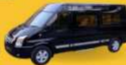
VAN (7-8 ท่าน)