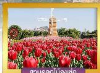
สวนดอกไม้จงเซอ