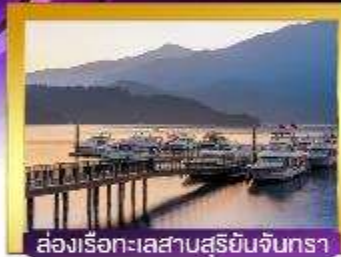
ช่องเรือทะเลสาบสุริยันจันทรา