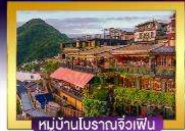
หมู่บ้านโบราณจิวเฟิน

อื่นอร่อยกับ Michelin Star เสี่ยวหลงเปา ปลาประ-ธนาธิบดี