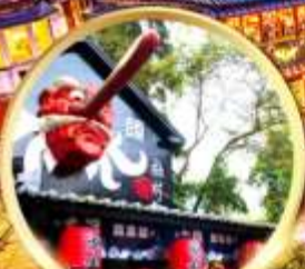
หมู่บ้านปิสางซีโกว