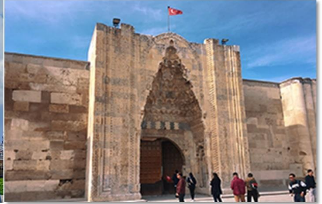
เที่ยง บริการอาหารกลางวัน ณ ภัตตาคาร

หลังอาหาร นำท่านเดินทางสู่ เมืองคัปปาโดเกีย Cappadocia ชมดินแดนที่มีภูมิประเทศอันน่าอัศจรรย์ ซึ่งในอดีตกาลมีกระแสน้ำภูเขาไฟที่ไหลออกมาปกคลุมพื้นที่เป็นบริเวณกว้าง แล้วทับถมเป็นเวลาหลายล้านปี และด้วยการกระทำของธรรมชาติ โดยการกัดเซาะของพายุลม ฝน หิมะ และ กาลเวลา ได้ปรุงแต่งดินแดนคัปปาโดเกียออกมาได้อย่างงดงาม แปลกตา และน่าอัศจรรย์ด้วยภูมิลักษณะต่างๆ เปรียบดังสวรรค์บนดินจนได้ชื่อว่า ดินแดนแห่งเทพนิยาย หรือดินแดนแห่งปล่องนางฟ้า Fairy Chimney คัปปาโดเกียยังได้รับการแต่งตั้งจากองค์การยูเนสโกให้เป็นเมืองมรดกโลกทางธรรมชาติและวัฒนธรรมแห่งแรกของตุรกีอีกด้วย