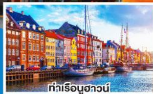
ท่าเรือชวานน์