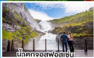
น้ำตกจอสฟอสเซ่น