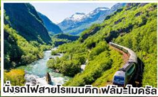
น้ำตกไฟสายโรเมนติก.ฟิล์มโบตรีล