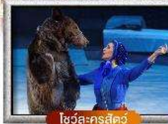
โซวล์-ครัสคัว