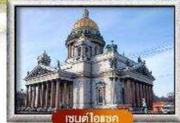
เซนต์ไอแซค