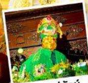
ซอพรแม่ยักย์