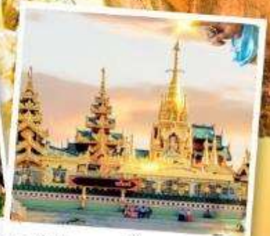
เจดีย์กลางน้ำ (สิเรียม)