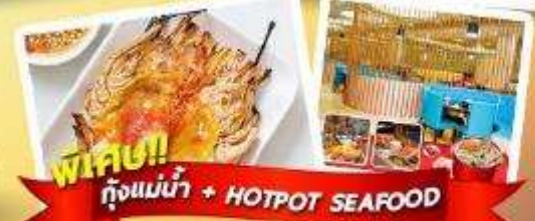
พิเศษ!! ก๊องแม่น้ำ + HOTPOT SEAFOOD