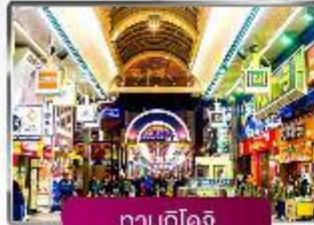
ทานุกิโดจิ