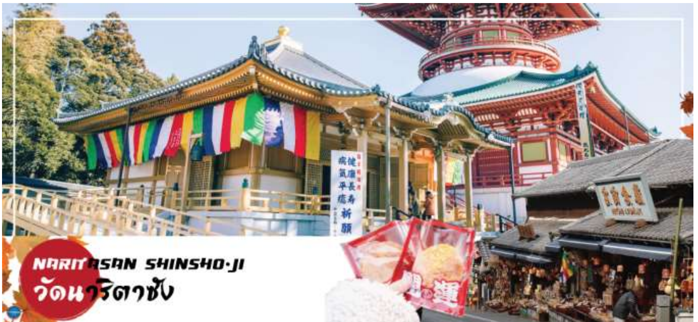
NARITASAN SHINSHO-JI วัดนาริตาชิน

เมืองนาริตะ – วัดนาริตะชิน – ถนนปลาไหล โอโมเตะซังโตะ – กรุงโตเกียว – ตลาดปลาซึกิจิ – ชมแมวยักษ์3มิติ พร้อมช้อปปิ้งย่านชินจูกุ – เมืองนาริตะ