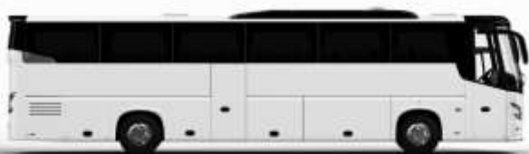
ตัวอย่างรถโดยสาร 1 ชั้น

ค่าที่พักตามที่ระบุในรายการหรือเทียบเท่าระดับเดียวกัน (พักห้องละ 2 ท่าน) หากประเภทห้องที่ท่านริเวควมาเดิม อาทิ เช่น 5 เควสห้องพักเป็น TWIN BED หรือ DOUBLE BED ทางบริษัทขอสงวนสิทธิ์ในการปรับประเภทห้องพัก เป็นตามที่โรงแรมมีอยู่ โดยไม่ต้องแจ้งให้ทราบล่วงหน้า