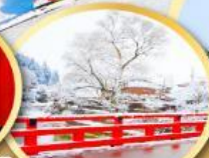
สะพานนากะบาชิ