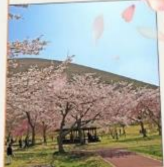
ซากุระ โนะ ซาโตะ