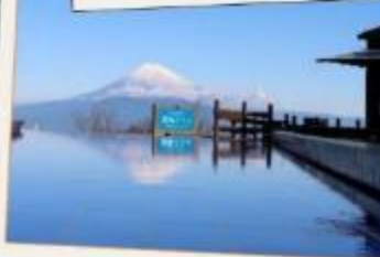
อิซุ พาโนราม่า พาร์ค