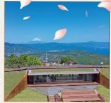
มิโซะ คาเฟ่321