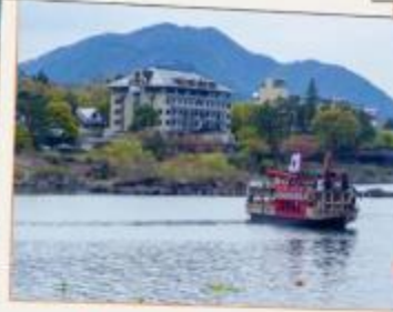
ล่องเรืออาปาเระ