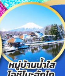
หมู่บ้านน้ำใส โอชิโนะฮักไก