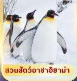
สวนสัตว์อาซาฮิยาม่า