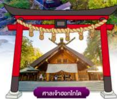
ศาลเจ้าออกโทโด