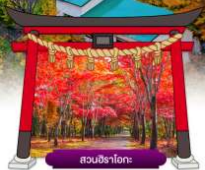
สวนชิราโอกะ