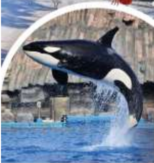
พิพิธภัณฑ์สัตว์น้ำท่าเรือนาโงย่า