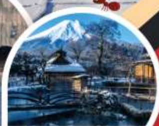
หมู่บ้านโฮชิโนะฮักโก