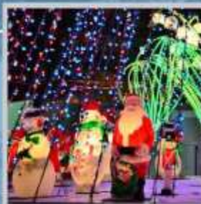
"ODORI GERMAN CHRISTMAS"