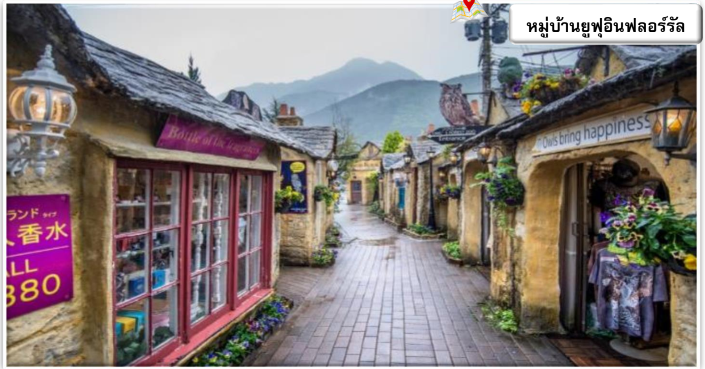
หมู่บ้านยูฟูอินฟลอรัล

เดินทางสู่ ยูฟูอิน (Yufuin) เป็นเมืองชนบทเล็กๆ ที่มีทิวทัศน์ที่สวยงามมากโดยเฉพาะช่วงฤดูใบไม้ผลิที่จะมีทั้งดอกซากุระบนต้นไม้ และดอกเรปซีป์ ที่พื้นด้านล่าง พร้อมกับแม่น้ำ และภูเขา อีสระเดินชม หมู่บ้านยูฟูอินฟลอรัล เป็นหมู่บ้านจำลองสไตล์ยุโรป มีกลิ่นอายยุโรปโบราณ ไฮไลท์ ประจำเมืองยูฟูอิน บ้านอิฐที่แสนคลาสสิกเรียงรายอยู่บนถนนสายเล็กๆ ประดับประดาไปด้วยดอกไม้หลากชนิด