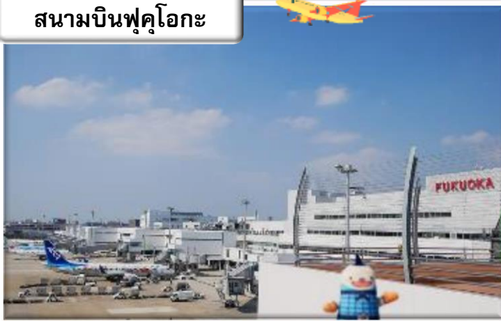
สนามบินฟุคุโอกะ

เวลา 00.55 น. ออกเดินทางสู่ สนามบินฟุคุโอกะ ประเทศ ญี่ปุ่น โดย สายการบินไทย เที่ยวบินที่ T5648