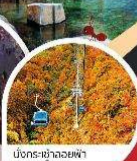
มังกร-ซาลอยฟ้า ตาก่อนโตล่า

ควาโทอะ • นาโอมะ • ทาการากิ • คุซัทสึ • ยูซากาตะ • นิทานานิ • โตเกียว