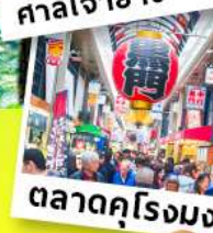
ตลาดคุโรมง