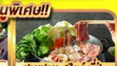
ชาบูชาบู สโตร์ญี่ปุ่น