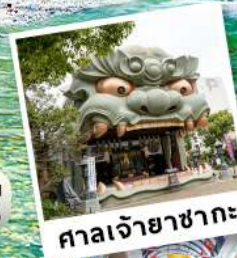
ศาลเจ้ายาซากะ