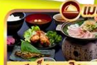
สเต็กหมูอิดะ