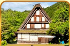
หมู่บ้านพื้นเมืองฮิดะ