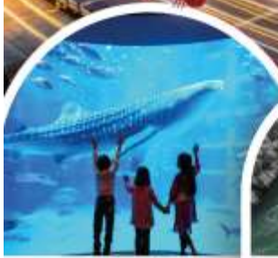
พิพิธภัณฑ์สัตว์น้ำโคคุยกัง