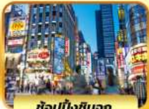
ช้อบบ้งชินจุกุ