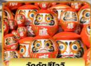
วัดค้ดล้ไอจ้