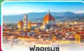
ฟลอเรนซ์