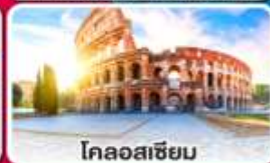
โคลอสเซียม

ลิ้มรสพาสต้า พิซซ่า และสปาเก็ตตี้ แบบต้นตำหรับอิตาลี