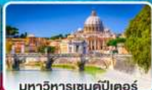
มหาวิหารเซนต์ปีเตอร์