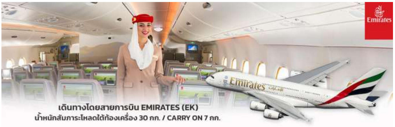
เดินทางโดยสายการบิน EMIRATES (EK) น้ำหนักสัมภาระโหลดใต้ท้องเครื่อง 30 กก. / CARRY ON 7 กก.