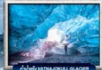
ถ้ำน้ำแข็ง VATNAJOKULL GLACIER

บินตรง สายการบิน Full Service | พิเศษ! ทานอาหารโดนตรง-จกตัว 360 องศา