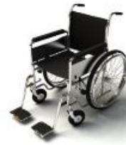
การรับการดูแลเป็นพิเศษ

กรณีผู้เดินทางต้องการความช่วยเหลือเป็นพิเศษ อาทิเช่น การใช้วีลแชร์ กรุณาแจ้งบริษัทฯ อย่างน้อย 7 วันก่อนการเดินทาง มิฉะนั้นบริษัทฯ จะไม่สามารถจัดการล่วงหน้าได้ เนื่องจากการขอใช้วีลแชร์ในสนามบินนั้น ต้องมีขั้นตอนในการขอล่วงหน้า และบางสายการบินอาจมีการเรียกเก็บค่าใช้จ่ายทั้งทางสนามบินในไทยและในต่างประเทศ ซึ่งผู้เดินทางสามารถสอบถามกับเจ้าหน้าที่ได้โดยตรงก่อนทำการจอง และหากในขณะของท่านมีผู้ต้องการดูแลพิเศษ เช่น ผู้ที่นั่งรถเข็น (Wheelchair), เด็ก, ผู้สูงอายุและผู้ที่มีโรคประจำตัวหรือไม่สะดวกในการเดินทางท่องเที่ยวในระยะเวลายาวนานกว่า 4 - 5 ชั่วโมงติดต่อกัน ท่านและครอบครัวต้องให้การดูแลสมาชิกภายในครอบครัวของตนเอง เนื่องจากการเดินทางเป็นหมู่คณะ หัวหน้าที่ัวร์มีความจำเป็นต้องดูแลคณะทัวร์ทั้งหมด