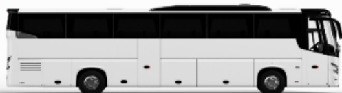
ตัวอย่างรูปภาพ 1 คัน

หากประเทศคือที่ท่านริเคอสมาดำเนินการ เช่น ริเคอสห้องพักเป็น TWIN BED หรือ DOUBLE BED ทางบริษัทขอสงวนสิทธิ์ในการปรับประเภทห้องพัก เป็นตามที่โรงแรมมีอยู่ โดยไม่ต้องแจ้งให้ทราบล่วงหน้า