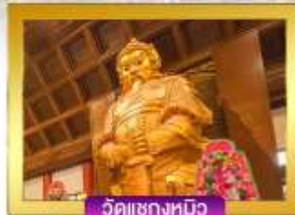
วัดเซกงหมิว