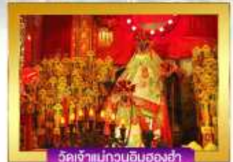
วัดเจ้าแม่กวนอิมฮองฮ่า