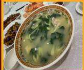
ซุปรนไฟหมู