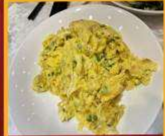
ไข่เจียวทรงเครื่อง