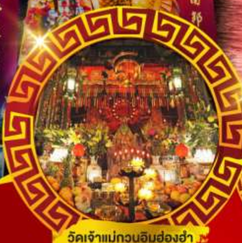
เจ็ดเจ้าแม่กวนอิมฮ่องฮ่า