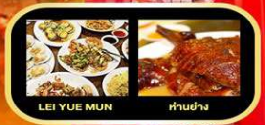
LEI YUE MUN