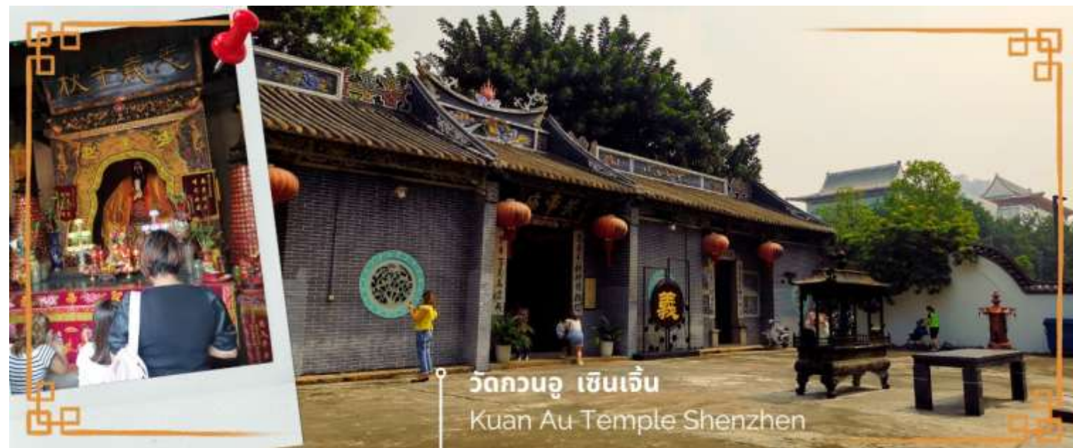
วัดกวนอู เซินเจิ้น Kuan Au Temple Shenzhen

จากนั้นนำท่านเดินทางสู่ วัดกวนอู ไหว้เทพเจ้ากวนอู สัญลักษณ์ของความซื่อสัตย์ ความกตัญญูรู้คุณ ความจงรักภักดี ความกล้าหาญ โชคลาภ และบารมี ท่านเปรียบเสมือนตัวแทนของความเข้มแข็งเด็ดเดี่ยวของอาจไม่ครั้งคร้ามต่อศัตรู ท่านเป็นคนจิตใจมั่นคงตั้งขุนเขา มีสติปัญญาเฉลียวฉลาด และไม่เคยประมาทการบูชาขอพรท่านก็หมายถึงขอให้ท่านช่วยอุดช่องว่างไม่ให้เพลิงงพล้ำแก่ฝ่ายตรงข้าม และให้เกิดความสมบูรณ์ด้วยคนข้างเคียงที่ซื่อสัตย์ หรือบิรวารที่ไว้วางใจได้นั่นเองดังนั้นประชาชนคนจีนจึงนิยมบูชา และกราบไหว้เพื่อความเป็นสิริมงคลต่อตนเอง และครอบครัวในทุกๆ ด้าน