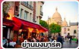
ย่านมงมาร์ต