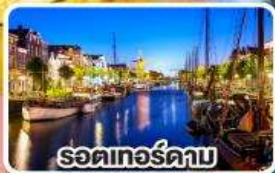
รอดเทอร์ดาบ