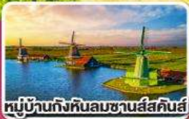
หมู่บ้านกังหันลมชาวนัสคินส์