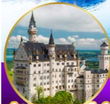
ปราสาทนอยชวานสไตน์