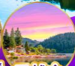
ทิทเซ่ ปาด่า