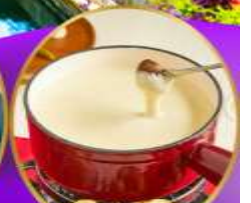
ฟองดูซีส