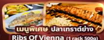
เมนูพิเศษ ปลาเทราต์ย่าง Ribs Of Vienna (1 rack 500g)

การ์นต์ 15 ท่านออกเดินทาง พร้อมหัวหน้าทัวร์คนไทย