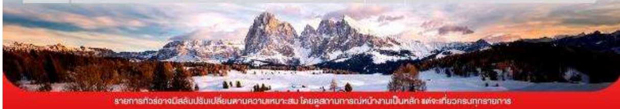
รายการทัวร์อาจเปลี่ยนแปลงปรับเปลี่ยนตามความเหมาะสม โดยดูสถานการณ์หน้างานเป็นหลัก แต่จะเกี่ยวข้องกับรายการอาหาร