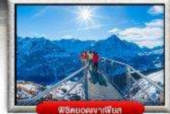
พริตยอดเขาเพียง

เดินทางโดยสายการบินเอมิเรตส์ อาหาร : 18 มื้อ โรงแรม : 4 คืน