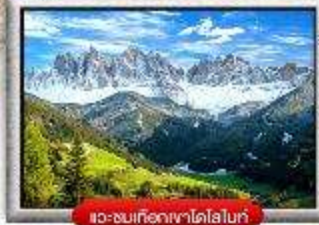
เขื่อนเทือกเขาโดโลไมท์