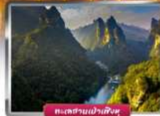
ทะเลสาบเป่าเฟิงหู