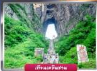
เทียนจินชาน