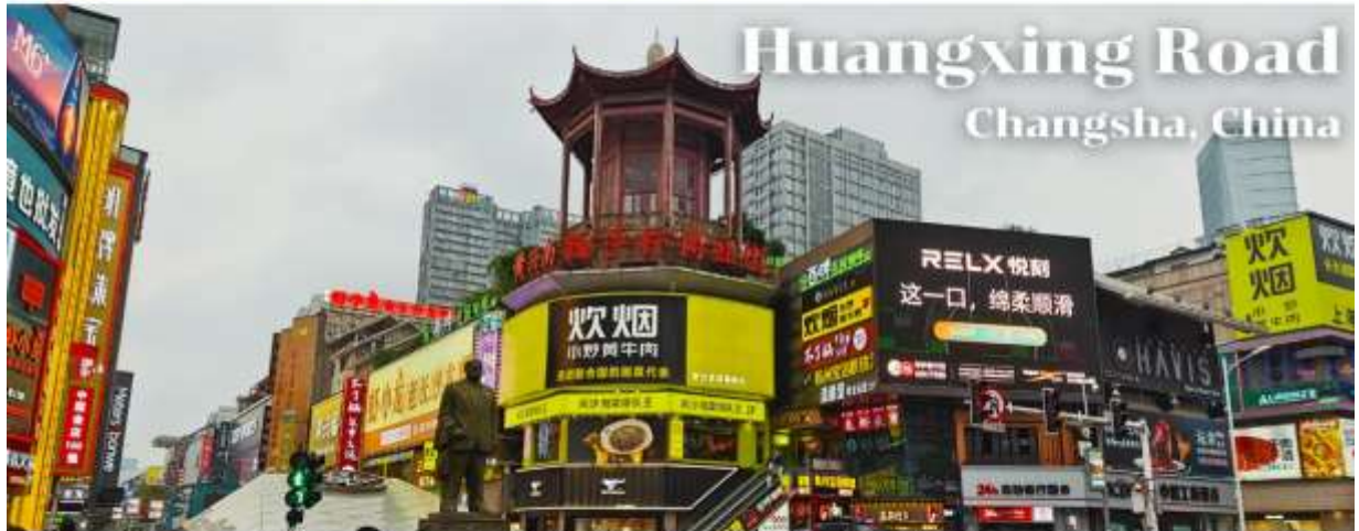
Huangxing Road Changsha, China