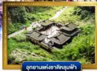
อุทยานแห่งชาติหลุมฟ้า