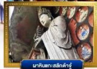
ผาหินแกะสลักคำจู้