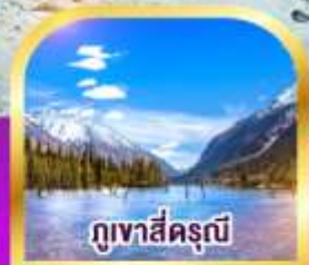
ภูเขาสี่ครุณี