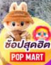
ช้อปสุดฮิต POP MART