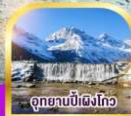
อุทยานบี้เผิงโกว