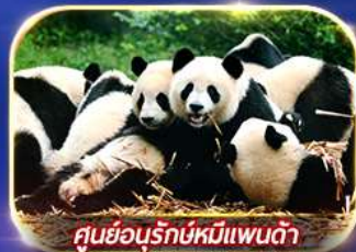
ศูนย์อนุรักษ์หมีแพนด้า