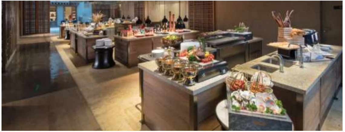
ที่พัก Hilton Jiuzhaigou Resort ระดับ 5 ดาว หรือเทียบเท่า