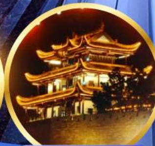
หอคอยทองคำเทียนซิน