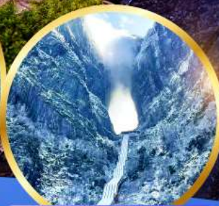
ประติศวรรค์ เทียนเหมินซาน