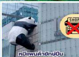
หมีแพนด้ายักษ์ปั้น ดีกถนนชุนซีลู่