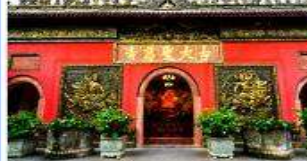
วัดต้าเจี๋ย