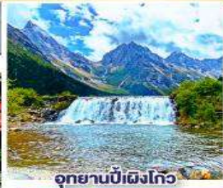
อุทยานปี้เผิงโกว