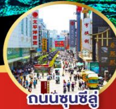
ถนนชุนชี่ลู่

05 – 10 ก.ย.67 28,900 06 – 11 ก.ย.67 28,900 07 – 12 ก.ย.67 28,900 12 – 17 ก.ย.67 28,900 13 – 18 ก.ย.67 28,900 14 – 19 ก.ย.67 28,900 19 – 24 ก.ย.67 28,900 21 – 26 ก.ย.67 28,900