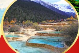
อุทยานหลวงหลง