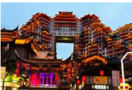
ตึกภัตตาคาร 72 ชั้น

พักที่ CHANGDE YUNXI HOTEL ระดับ 4 ดาวท้องถิ่น หรือเทียบเท่าในเมืองฉางเต๋อ