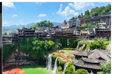
เมืองโบราณฟูหวงเจิน