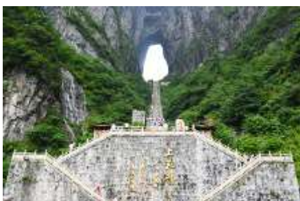
ประตูลูกศร