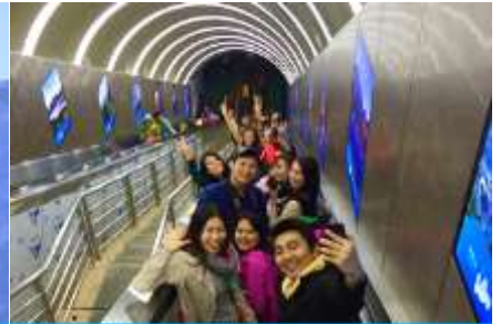
บันไดเลื่อนทะเลภูเขา

วันที่ 1 เมืองโบราณฝูหรงจิน – ศูนย์ผลิตภัณฑ์ยางพารา– กระเช้าขึ้นเขายินเหมินซาน – ระเบียงแก้ว เลียบน้ำผา – บันไดเลื่อนทะเลภูเขา – (เลือกซื้อโปรแกรม ออฟชั่น โชว์จิ้งจอกขาว)